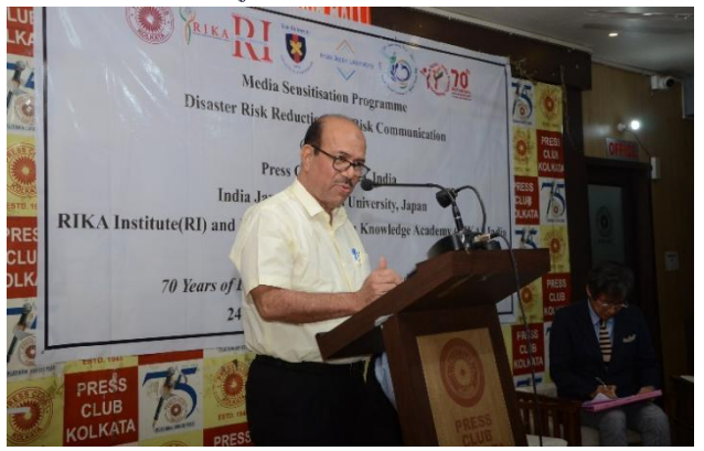
Fig 1 b. HE Javed Khan, Hon. Minister for Disaster Management and Civil Defence. Govt. of West Bengal delivering the inaugural speech.